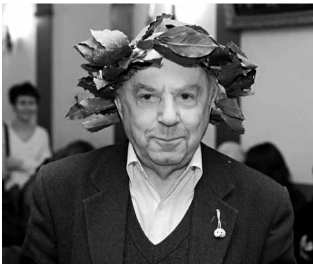
ЦДЛ, 18 марта 2010 года.

только одно из двух: либо исчезнуть навсегда, либо срочно становиться гением (увы, второе происходило гораздо реже).