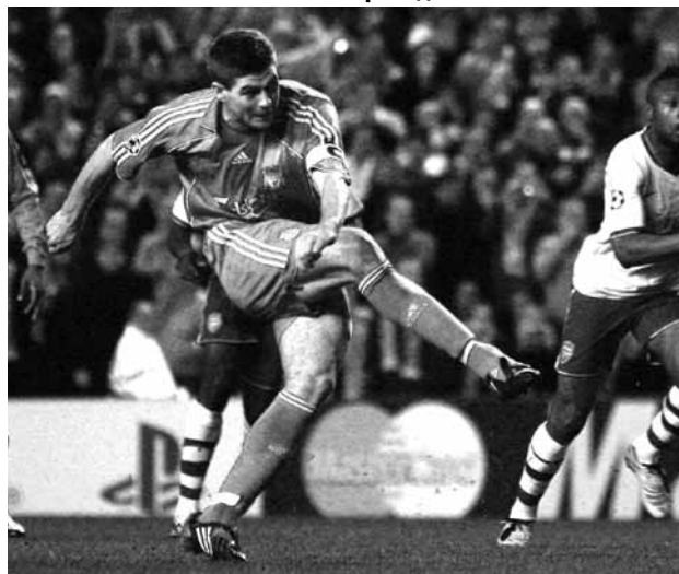
Капитан футбольного клуба «Ливерпуль» Стив Джеррард.