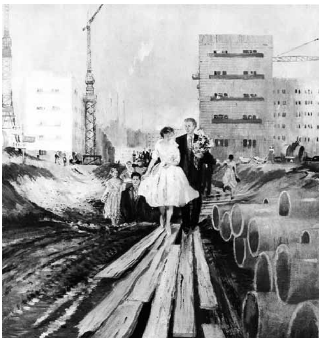
Юрий Пименов. Свадьба на затрашенной улице

Вы спросите: «Почему так?» Да просто так принято.