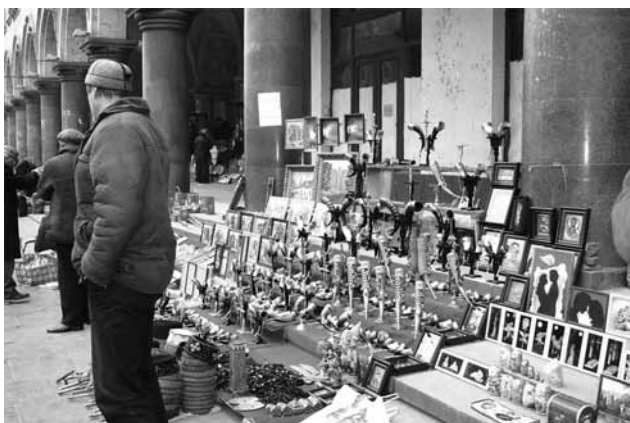
Продажа сувениров на проспекте Руставели, в 300 метрах от парламента Грузии.

Какие перспективы Вы видите у национальной культуры вашей страны? (Вопрос сформулирован чудовищно, но мне хотелось бы, чтобы Вы сформулировали какое-то резюме).