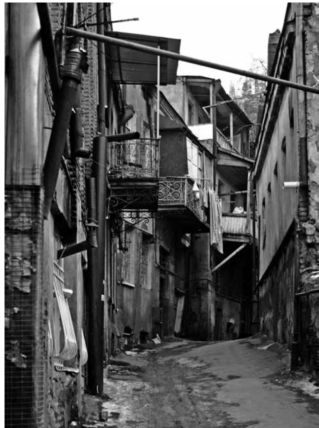
Старый Тифлис.

15 ноября. Прошёлся по Руставели. Туда и обратно. Здесь большая вероятность кого-нибудь встретить и поговорить. Много красивых девочек гуляет. Завёл за привычку такие прогулки. На Земеле в доме Тер-Казаряна как-то приметил одного субъекта. Дом выстроен в готическом стиле с башнями. Тот тип постоянно торчал в окне одной из башен. Каждый раз, проходя мимо, невольно глаза поднимал, чтобы убедиться, что тот мужик на «посту стоит». Взгляд у него неподвижный.